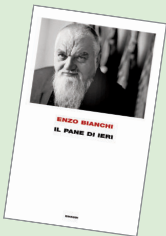
ENZO BIANCHI Il pane di ieri Einaudi 2008, pp. 114, €6,50

Enzo Bianchi, priore di Bose, racconta storie e rievoca volti della propria esistenza: il Natale di tanti anni fa e la tavola imbandita per gli amici, il suono delle campane nella veglia dell'alba e il